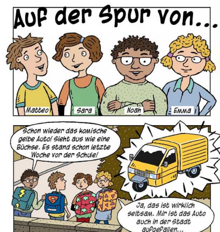
Comic: „Auf der Spur von ...“

Zentrale Plattform für die Kampagne ist die Website www.netla.ch . Hier fördern zwei Online-Games für verschiedene Altersgruppen die spielerische Auseinandersetzung mit dem eigenen Verhalten im Internet. Kinder und Jugendliche können Ratschläge und Tipps abrufen, die ihrem Online-Verhalten Rechnung tragen. Mit einem Quiz soll das neue Wissen vertieft werden. Eltern finden nützliche Hinweise zum Umgang mit der Thematik, Lehrpersonen können Lehrmittel und Arbeitsblätter für den Unterricht herunterladen.