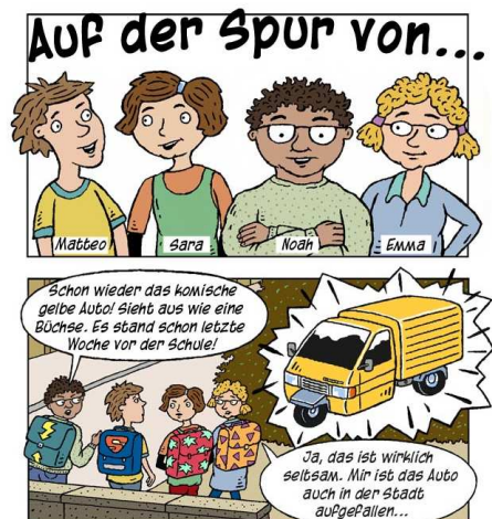
BD: « Sur les traces de ... »

La plate-forme centrale de cette campagne est le site web www.netla.ch . Deux jeux en ligne pour les différents groupes d'âges incitent les participants de façon ludique à se poser des questions sur leur comportement sur Internet. Les enfants et adolescents peuvent faire appel à des conseils et à des trucs liés à leur comportement en ligne. Les acquis sont renforcés au moyen d'un quizz. Les